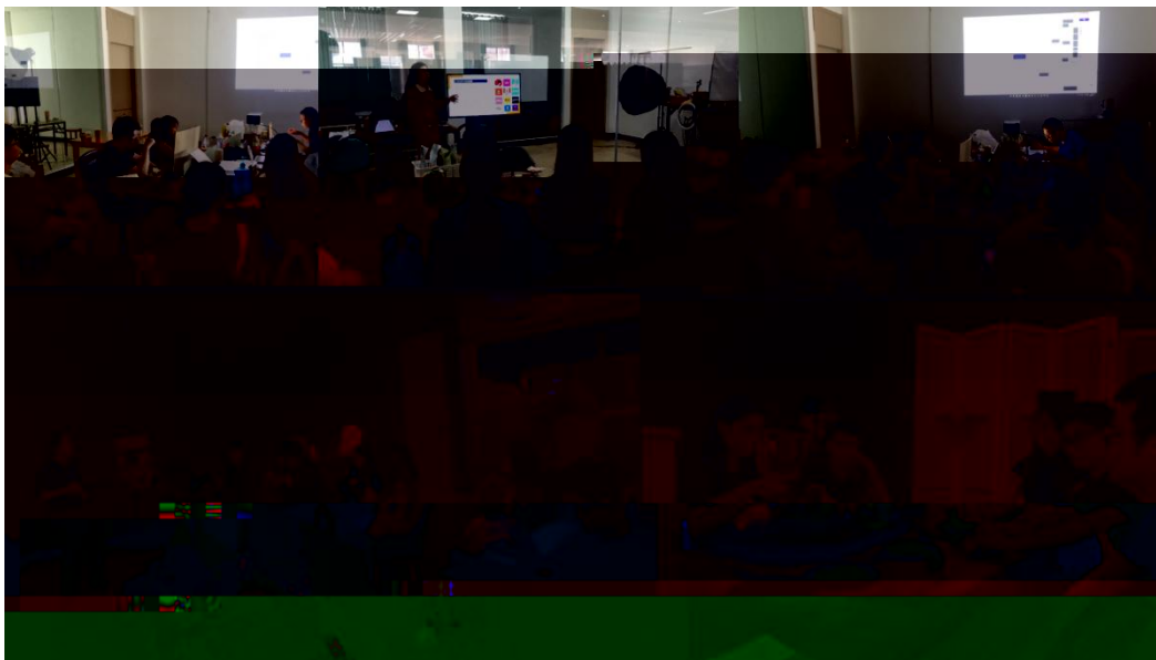
图 特邀企业专家来基地为学生进行专业培训

地 2023 地 ( 2), 供 宝贵的 。 过 的分 , 度 、 场变 , 对电 播 的 。 不 的 储备, 高 操 , 的 发 奠定 础。 措 合 的 度, 地 合 的 。