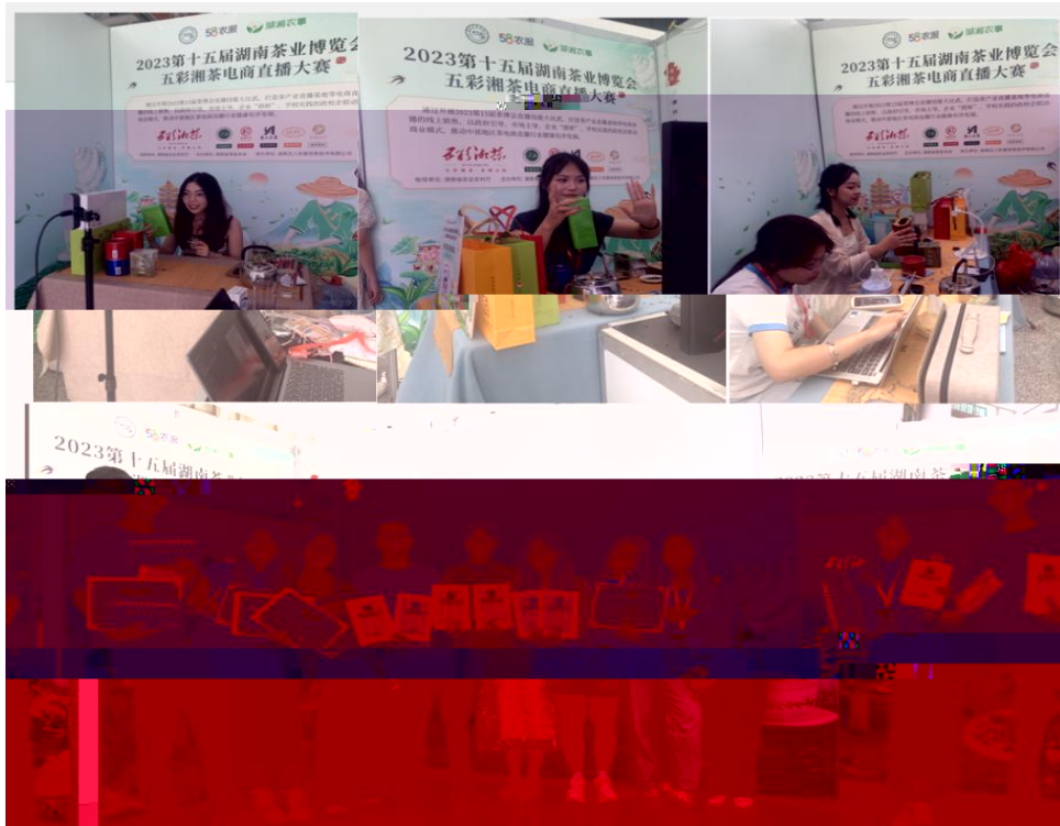
图 “湖南省第十五届茶博会” 电商直播比赛现场

播和方的，短 得的步。 队比 10多单、单， 包但不、等多个，的 和队得的高度。的 得不对公的，更对参 付出和的充分定。